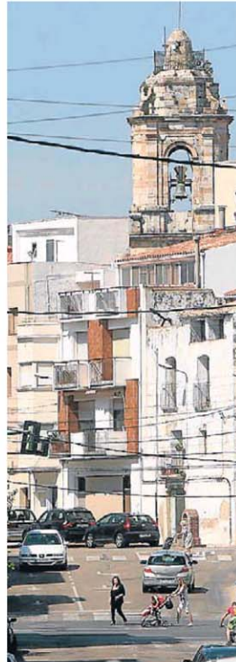
El poble de la Sénia (Montsià) VICENC LLURBA

Todó descriu la vida de la Sénia: la festa major, amb les carreres de cavalls o de burros, que marquen distàncies de classe, la relació entre la gent del poble i la gent forana, a propòsit d'un dinar en un mas on ja fa anys que no viu ningú. Falses tradicions, com la música de dolçaina, i tradicions que s'en-