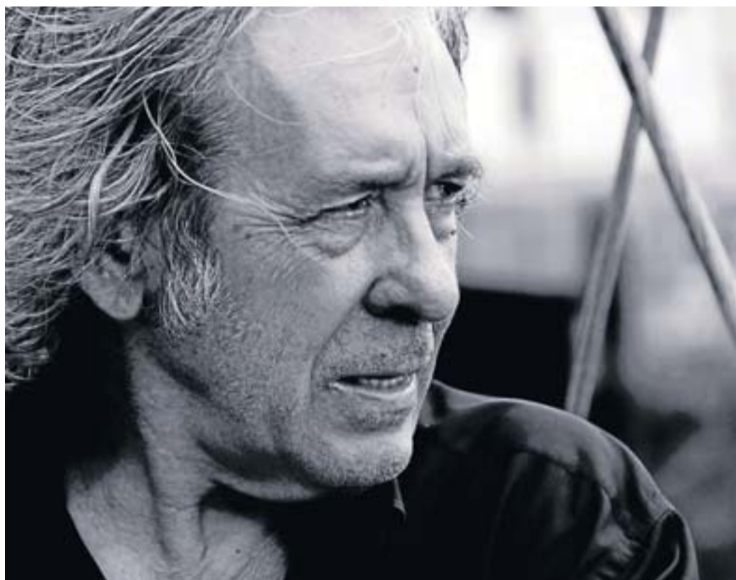
A FLOR DE TIEMPO

El maig del 2011 va fer un concert per als indignats acampats a la plaça Catalunya. Com valora el 15-M?