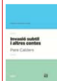
INVASIÓ SUBTIL I ALTRES CONTES PERE CALDERS EDICIONS 62 144 PÀG./9,95 € (AQUEST DIUMENGE, AMBL'ARA)

Calders se situa entre l'humor enginyós i la paranoia tendra, com és el cas de la narració que titula el llibre, en què un home està convençut d'haver sopat amb un japonès, tot i tenir una aparença idèntica a la seva i compartir els mateixos hàbits alimentaris. El volum està integrat per disset peces i un últim apartat de contes breus, entre els quals hi ha Copyright : "Algú m'ha fet a mi i he estat venut. Mai no he pogut saber qui ha cobrat els drets ni si he estat un bon o un mal negoci". ♦♦