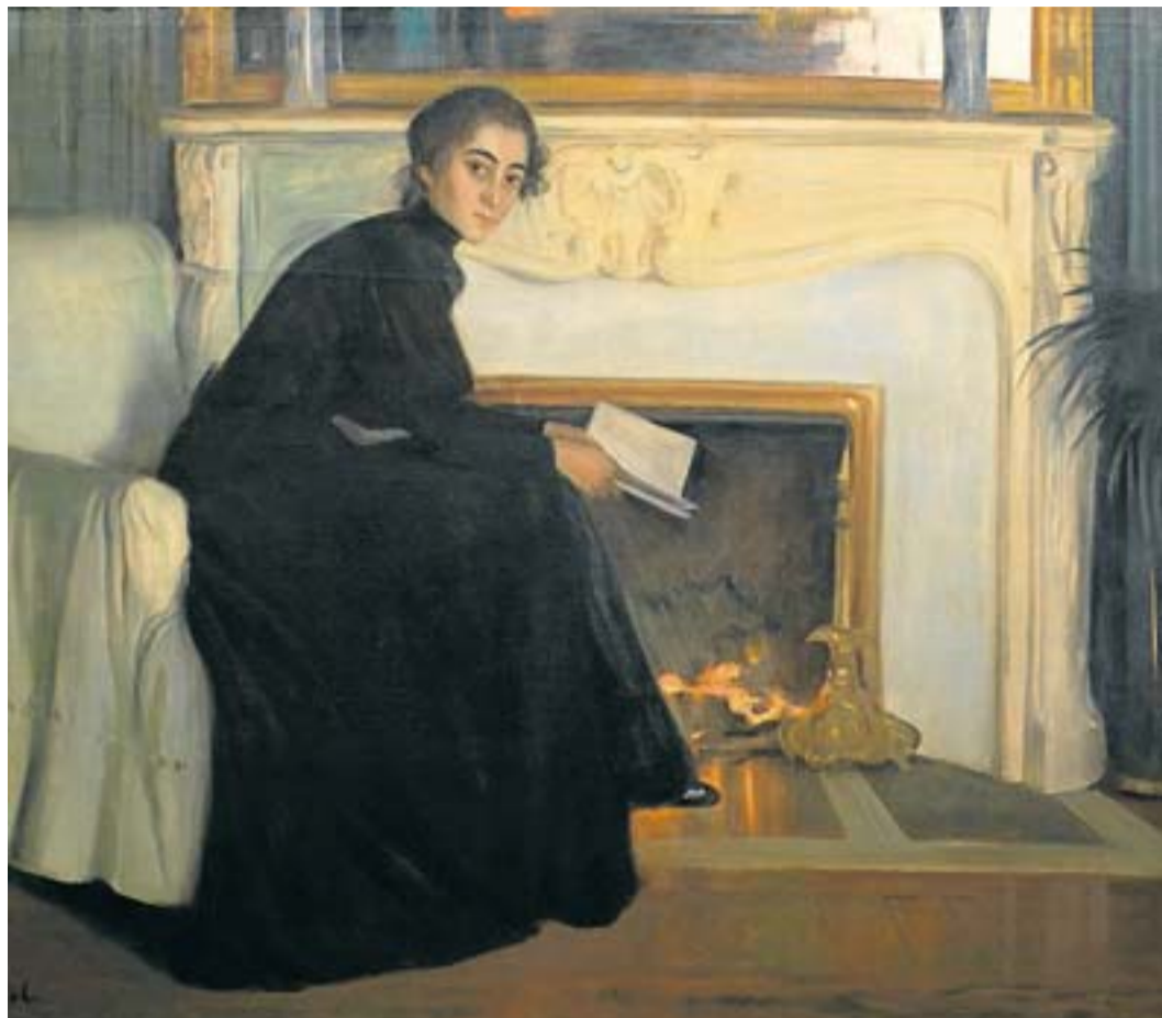
Santiago Rusiñol va pintar quadres com Novel·la romàntica (1894). MNAC