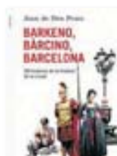
Barkeno, Bàrcino...

Amb Niños en el tiempo , Ricardo Menéndez Salmón confirma una vegada més que és un dels noms essencials de les lletres espanyoles de l'actualitat. Niños en el tiempo arriba menys de dos anys després de l'excel·lent Medusa i narra el final d'un matrimoni a través dels ulls del seu fill, el relat d'una infantesa possible de Jesús a Palestina i el viatge a l'illa de Creta d'una dona que ha de prendre una decisió important.